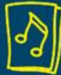
EIN LIEDBLATT [DOWNLOAD]