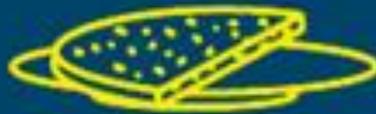
EIN STÜCK BROT